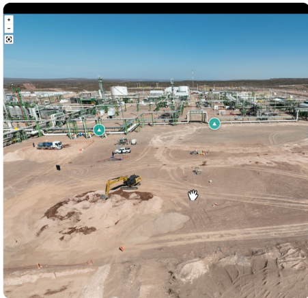
Captura en campo

Proyectos activos en Oil & Gas — Vaca Muerta. Clientes: TGS · Phoenix