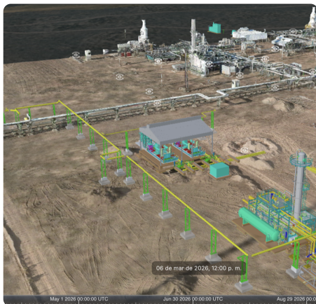
Visor 4D BIM